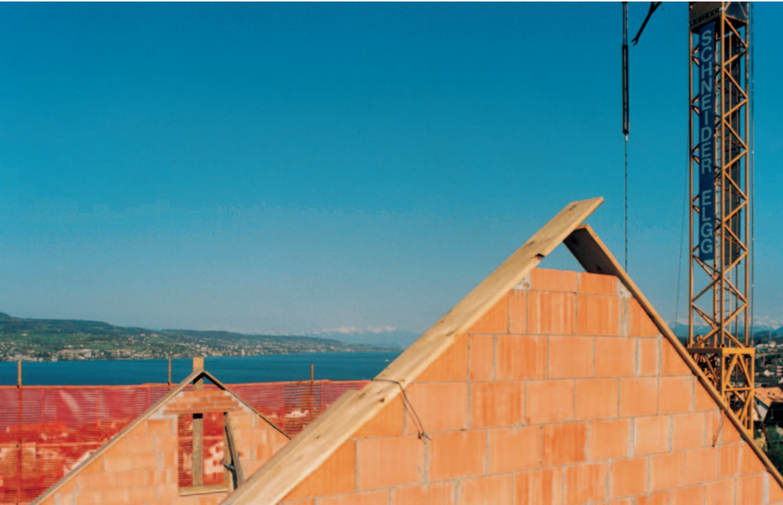
Neubau, Frühling '98